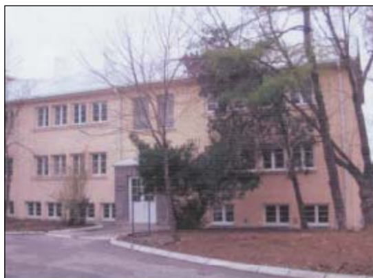
Zrekonstruovaný pavilon urologie nemocnice v Bělehradě

ze studená. Tyto zážitky mi nedovolily vzdát to a dávaly mi sílu pokračovat.