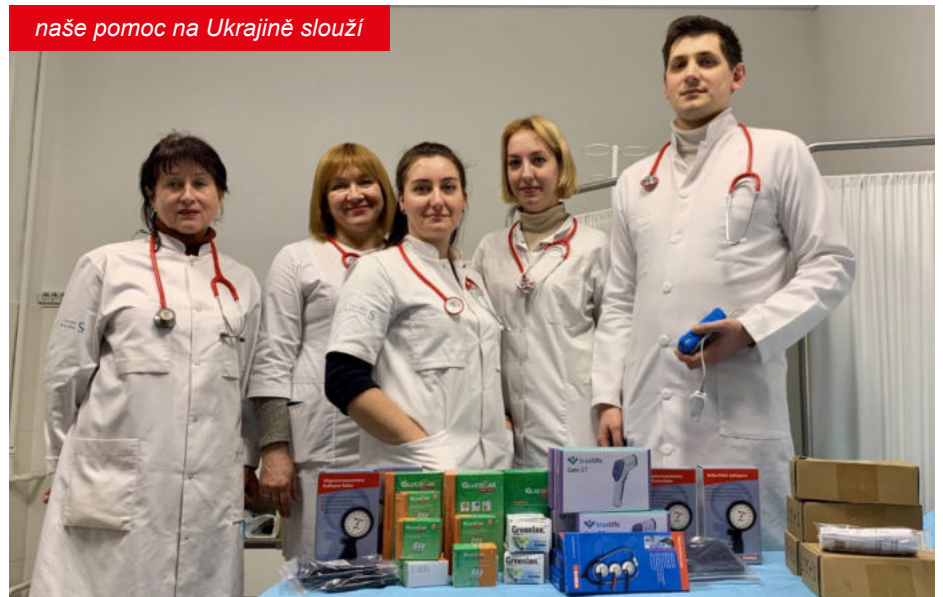
naše pomoc na Ukrajině slouží

Celkově na Ukrajině již jezdí 45 námi dodaných vozidel (a několik elektrokolobě-