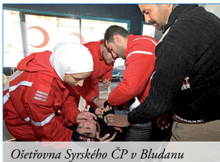
Ošetrovna Syrského ČP v Bludanu

působící , přizpůsobili své pomocné aktivity aktuálním podmínkám ozbrojených událostí, jejich pomoci se již dostalo více