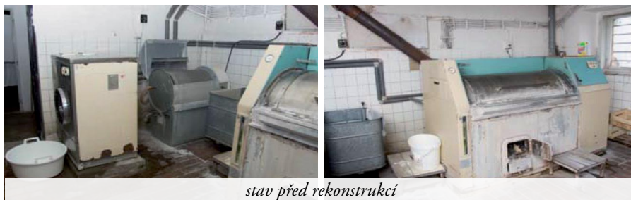
stav před rekonstrukcí

Prádelna léčebny byla provozu od roku 1974 s původním technologickým vybavením. Provoz prádelny je zde nepřetržitý a slouží k praní, sušení, mandlování a žehlení jak ústavního prádla pro vlastní potřeby,