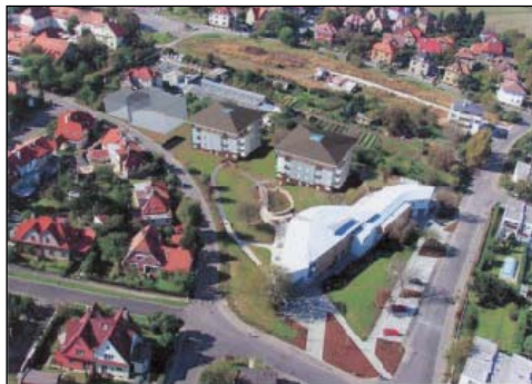
Dům seniorů Hvězda v Praze 6